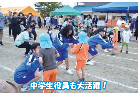
中学生役員も大活躍!