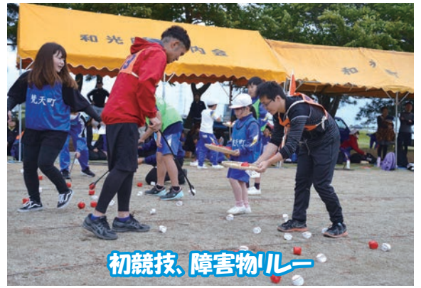
初競技、障害物リレー