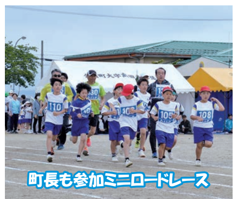
町長も参加ミニロードレース